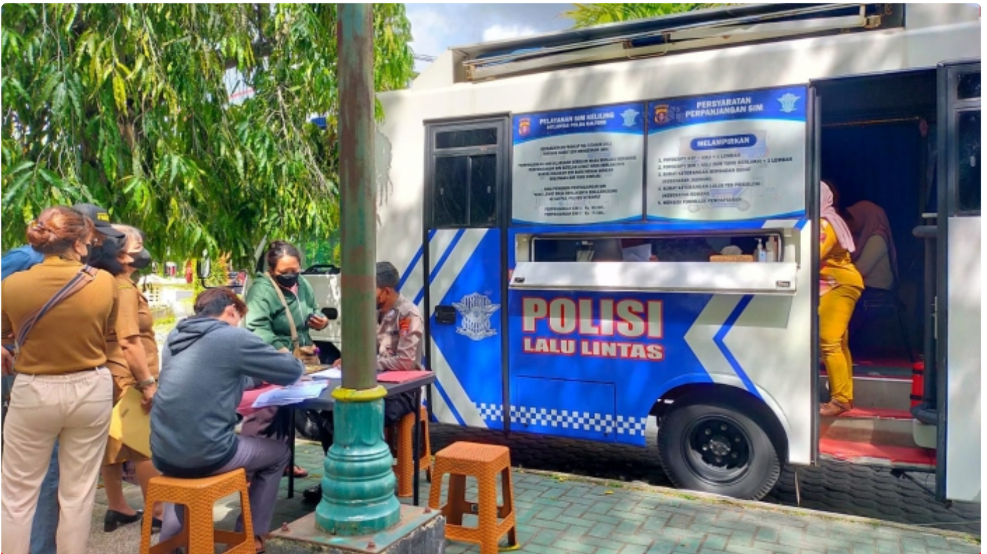
Bus Keliling Dirlantas Polda Kalteng

PALANGKA RAYA - Direktorat Lalu Lintas (Dirlantas) Polda Kalteng berikan pelayanan Surat Ijin Mengemudi (SIM) keliling bagi masyarakat Kota Palangka Raya. Selasa (6/12/2022) Pagi.